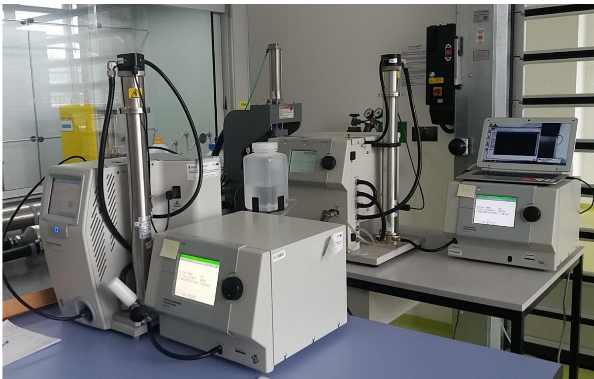
Rys. 1. Stanowisko do badania parametrów materiałów włókninowych podczas filtracji nanoaerozoli

Zbudowane stanowisko badawcze umożliwia prowadzenie badań materiałów filtracyjnych wszystkich klas pod kątem wyznaczenia początkowego oporu przepływu oraz skuteczności zatrzymywania cząstek nanoaerozoli w stanie wyjściowym oraz po kondycjonowaniu w oparach 2-propanolu. Standardowo badanie wykonuje się z zastosowaniem aerozolu testowego cząstek ciekłych bis(2-etyloheksylu) sebacynianu (DEHS) o polidispersyjnym rozkładzie wielkości, jednak po zmianie konfiguracji stanowiska możliwe jest prowadzenie badań z wykorzystaniem aerozolu o rozkładzie monodispersyjnym. Aerozol testowy może być generowany za pomocą generatora Topas SLG 270. Neutralizacja ładunku nanoobjektów przeprowadzana jest za pomocą neutralizatora ze źródłem radioaktywnym TSI 3054A. Pomiar stężenia liczbowego nanoobjektów w strumieniu aerozolu realizowany jest za pomocą dwóch liczników kondensacyjnych: TSI 3776 oraz TSI 3775, współpracujących z klasyfikatorami elektrostatycznymi TSI 3082 oraz TSI 3080.