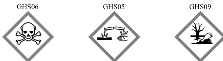
Rys. 1. Kody hasła ostrzegawczego „Niebezpieczeństwo”. Piktogramy określone w rozporządzeniu WE nr 1272/2008 (CLP) mają czarny symbol na białym tle z czerwonym obramowaniem, na tyle szerokim, aby było wyraźnie widoczne

Acute tox. 3 – toksyczność ostra (po narażeniu dermalnym), kategoria zagrożenia 3., H311 – działa toksycznie w kontakcie ze skórą, Acute tox. 3 – toksyczność ostra (droga doustna), kategoria zagrożenia 3., H301 – działa toksycznie po połknięciu, Eye dam. 1 – uszkodzenie oczu/działa drażniąco na oczy, kategoria zagrożenia 1., H318 – powoduje poważne uszkodzenie oczu, Skin sens. 1 – działa uczulająco na skórę, kategoria zagrożenia 1., H317 – może powodować reakcję alergiczną skóry, Aquatic acute 1 – stwarza zagrożenie dla środowiska wodnego, kategoria 1., H400 – działa bardzo toksycznie na organizmy wodne, Aquatic chronic 1 – przewlekła toksyczność dla środowiska wodnego, kategoria 1., działa bardzo toksycznie na organizmy wodne, powodując długotrwałe zmiany, Dgr – niebezpieczeństwo.