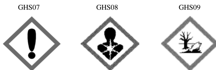
Rys. 1. Kod hasła ostrzegawczego: „Niebezpieczeństwo”. Piktogramy określone w rozporządzeniu WE nr 1272/2008 (CLP) mają czarny symbol na białym tle z czerwonym obramowaniem, na tyle szerokim, aby było wyraźnie widoczne